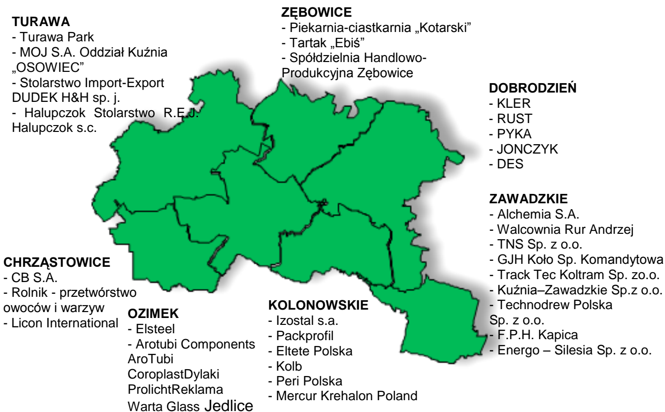
Rysunek 2 Najważniejsze podmioty gospodarcze obszaru Krainy Dinozaurów