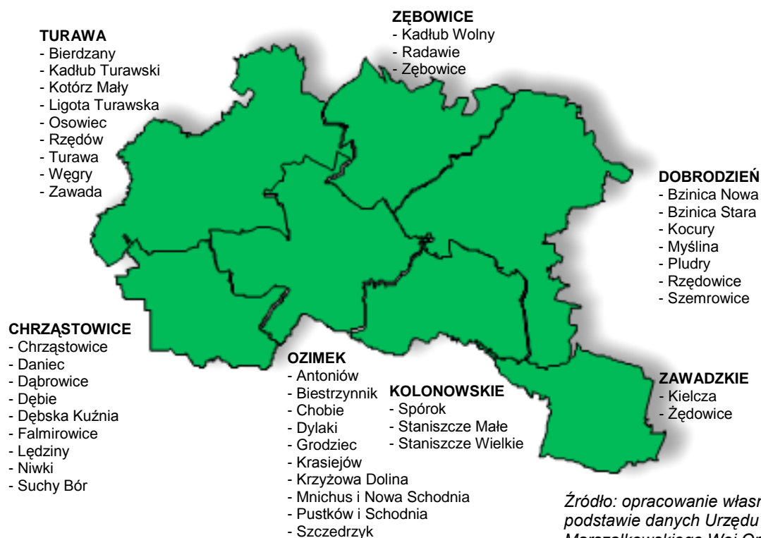
Rysunek 3 Sołectwa uczestniczące w regionalnym programie odnowy wsi