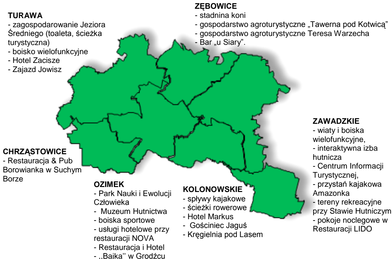
Rysunek 4 Nowe atrakcje i obiekty istotne z punktu widzenia rozwoju turystyki na obszarze LGD