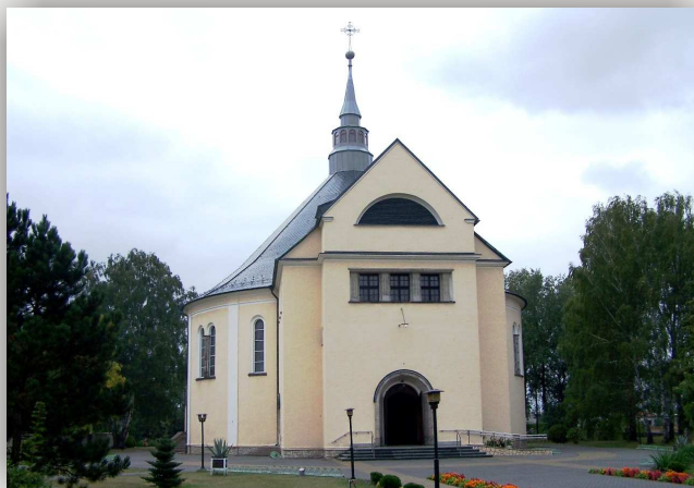
Kolonowskie, kościół katolicki