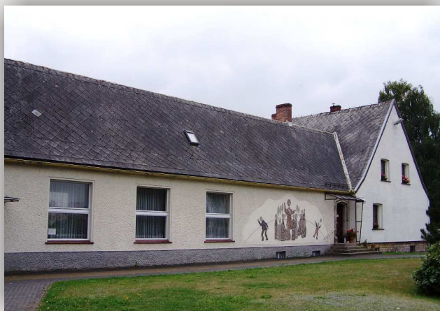
Kolonowskie, plebania przy kościele katolickim