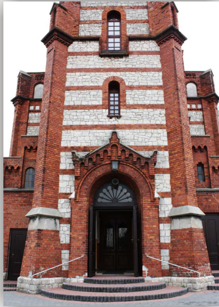
Staniszcze Wielkie, Kościół parafialny p.w. św. Karola Boromeusza