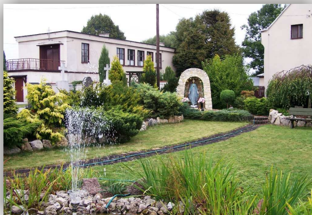
Staniszczewo Wielkie, kapliczka przy kościele