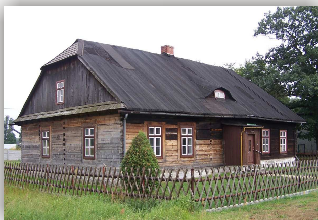
Kolonowskie, budynek muzeum „chałupa”, ul. Leśna 8