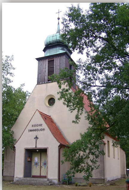
Kolonowskie, krzyż na cmentarzu ul. Ks. Czerwionki Kościół ewangelicki