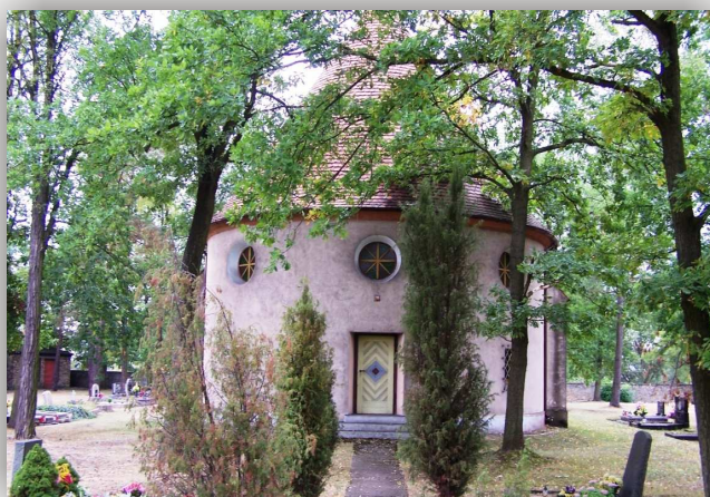
Kolonowskie, kościół ewangelicki z fragmentem cmentarza